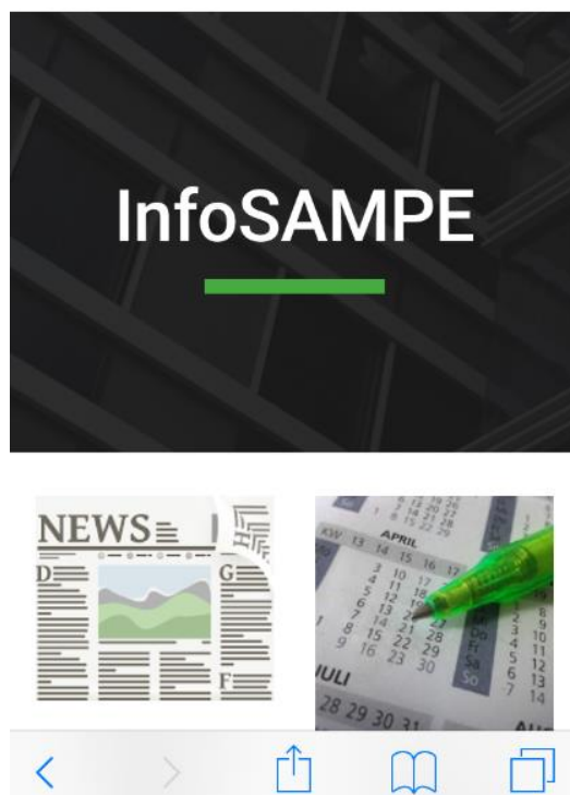
Figura 2: Imagem do aplicativo InfoSAMPE (2019)

Abaixo se apresenta a fotografia do aplicativo, quando aberto, pode se observar todos os ícones citados acima.